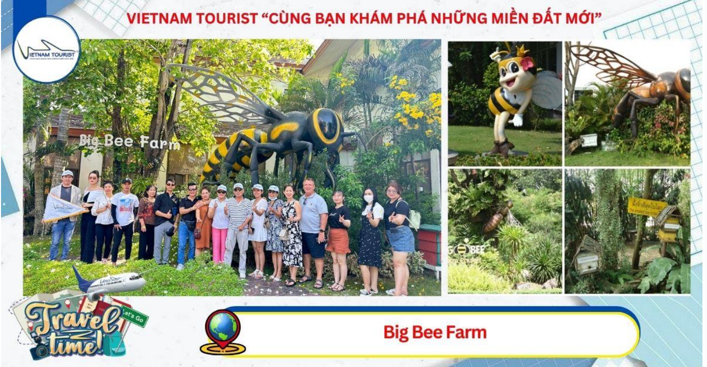
Big Bee Farm

17h00: Xe đưa quý khách đi dùng bữa tối.