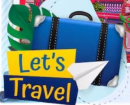
📍 CHÙA SÀ LÔN (CHÙA CHÉN KIẾU)

14h30: Quý khách tiếp tục đến thăm quan chùa Wat Pătum Wôngsa Som Rông với những góc chụp ảo như những ngôi chùa ở Thái Lan. Chùa Bôtum Vong Sa Som Rong hay còn được người dân địa phương quen gọi là chùa Som Rong . Chùa được xây dựng cách nay đã trên 600 năm. Ngoài ra, nơi đây sắp khánh thành TƯỢNG PHẬT THÍCH CA NĂM lớn nhất Việt Nam.