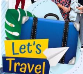
📍 CHÙA WAT PĂTUM WÔNGSA SOM RÔNG (SOM RONG)

VIETNAM TOURIST TRAVELS SERVICE AND TRADING JOINT STOCK COMPANY